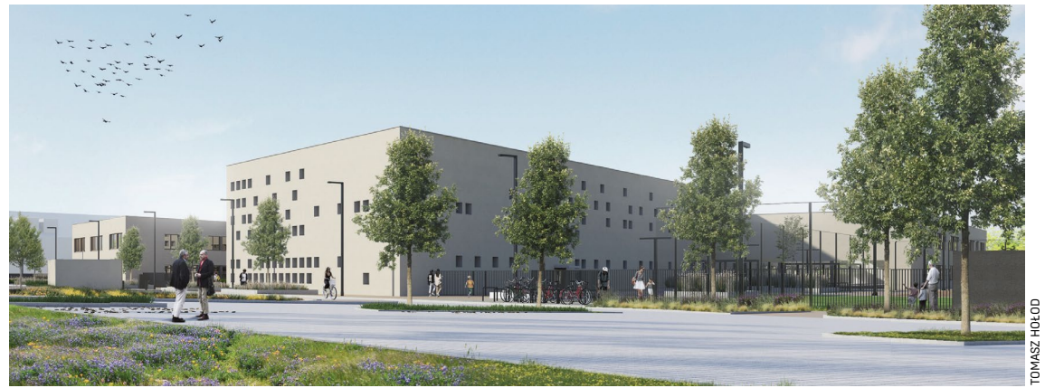
Zespół Szkolno-Przedszkolny przy ul. Asfaltowej we Wrocławiu przyjmie w sumie 1200 dzieci

opadową i wykorzystywać ją do podlewania ogródka. Koszt budowy to ok. 15 mln zł. Rekrutację do przedszkola przy al. Hallera prowadzi Zespół Przedszkoli nr 1 przy ul. Kolbuszowskiej 6.